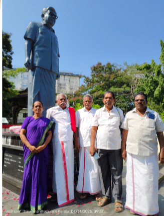
தேசியக் குழுவில் நிறைவேற்றப்பட்ட தீர்மானங்கள் அடுத்த இதழில் வெளியிடப்படும்.

மாநில மாநாடுகளின் தேதிகளை உறுதி செய்து, அவற்றில் தலைமையின் சார்பில் பங்கேற்க வேண்டிய செயற்குழு, நிர்வாகக் குழு உறுப்பினர் பட்டியலைக் கூட்டம் இறுதிப்படுத்தியது.