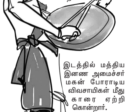
இடத்தில் மத்திய இணை அமைச்சர் மகன் போராடிய விவசாயிகள் மீது காரை ஏற்றி கொன்றார்.

இந்த போராட்டத்தில் ஏறத்தாழ 700 விவசாயிகள் இறந்து போனார்கள், இரக்கமே இல்லாமல் லக்கிம்பூர்கேரி என்ற