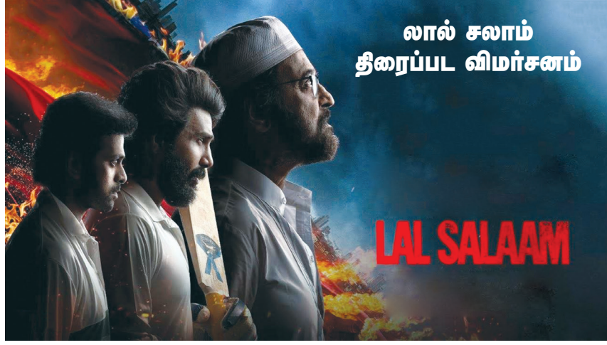
லால் சலாம் திரைப்பட விமர்சனம்

டீம்களும் என்ன ஆயின என்பதுதான் இந்த திரைப்படத்தின் கதை.