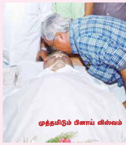
முத்தமிடும் பினாய் விஸ்வம்

அவர் முழுமையான ஈடுபாடும், அர்ப்பணிப்பும் கொண்ட உறுதியான மனிதர். அவர் கேரளாவில் இந்திய கம்யூனிஸ்ட் கட்சியையும், இடதுசாரி ஒற்றுமையையும், இடது ஜனநாயக முன்னணியையும் பெரிதும் வலிமைப்படுத்தினார். அவரது தலைமையில், உறுப்பினர் எண்ணிக்கையிலும், வலிமைமிக்க போராட்டங்களாலும் இந்திய கம்யூனிஸ்ட் கட்சி பெரும் முன்னேற்றத்தை கண்டது. என் அஞ்சலி. - இந்திய கம்யூனிஸ்ட் கட்சி பொதுச் செயலாளர் டி ராஜா