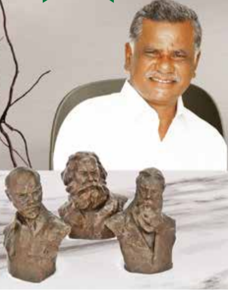
போர்க்குணம் மிக்க தோழர்களே!

பாஜகவை எதிர்த்து நிற்பதில், டெல்லியை ஆளும்