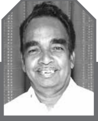
பி. எஸ். மாசிலாமணி

பெண்ணையாறு என்ற பெயரில் இரு நதிகள் உள் வந்து, பேர் சொல்லி வங்கக்கடலில் சங்கமம் ஆகிறது.