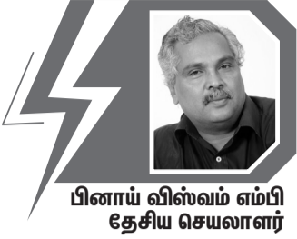
பினாய் விஸ்வம் எம்பி தேசிய செயலாளர்