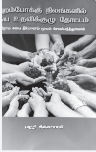
புறம்போக்கு நிலங்களில் சுய உதவிக்குழு தோட்டம்

பெண்கள் எந்த தேவைகளுக்காகவும் மற்றவர்களை சார்ந்து இருக்கக் கூடாது. தங்கள் சுய தேவைகளை தாங்களே பூர்த்தி செய்து கொள்ள வேண்டும் என்கின்ற அடிப்படையில், அரசால் ஆதரிக்கப்படும் ஒரு அமைப்பு மகளிர் சுய உதவிக்குழுக்கள். இவர்கள் தங்கள் பொருளாதாரத்தையும், சமூக தேவைகளையும் தாங்களே திட்டமிட்டு வளர்த்துக் கொள்ளும் வகையில் பயிற்சி அளிக்கப்படுகிறது. இதன் மூலம் சில பெண்கள் சமூகத்தில் நல்ல வளர்ச்சியை கண்டிருக்கிறார்கள். இதை அனைத்து பெண்களும் பயன்படுத்திக் கொள்ள வேண்டும் என்கிற உந்துதலிலே 'புறம்போக்கு நிலங்களில் சுய உதவிக்குழு தோட்டம்' என்கிற இந்த நூலை பாரதி சின்னச்சாமி எழுதி உள்ளார்.