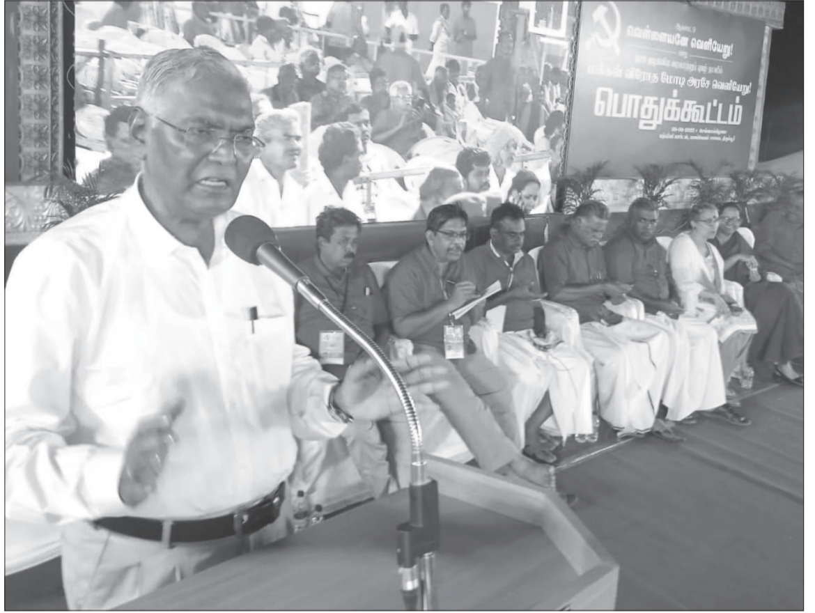
மாநாட்டையொட்டி செம்படை பேரணி திருப்பூர் ஸ்ரீசக்தி திரையரங்கம் அருகில் பிற்பகல் 3 மணி அளவில் தொடங்கியது. இந்தப் பேரணியானது நகரின் முக்கிய வீதிகள் வழியாக சென்று

பேரணியில் இரண்டு லட்சத்திற்கும் மேற்பட்டோர் பங்கேற்பு: