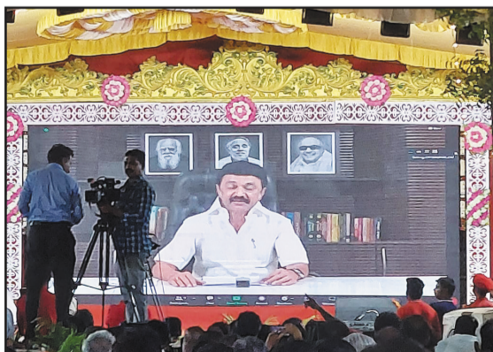
இந்தியக் கம்யூனிஸ்ட் கட்சியின் மாநில மாநாட்டினை வாழ்த்தி தமிழக முதல்வர் மு.க.ஸ்டாலின் காணொலி மூலம் உரையாற்றினார்

இந்தியக் கம்யூனிஸ்ட் கட்சியின் 25 ஆவது மாநில மாநாடு திருப்பூரில் ஆகஸ்ட் 6 ஆம் தேதி தொடங்கி 9 ஆம் தேதி வரையில் நடைபெற்றது. இந்த மாநாட்டில் அரசியல் சூழ்நிலை குறித்து விரிவாக விவாதிக்கப்பட்டது.